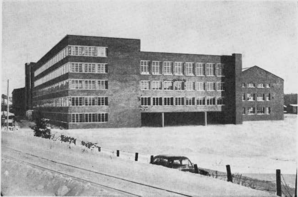
Askon Tehtaiden julkisivu syksyllä 1955 loppunsaatettujen laajennusten jälkeen.